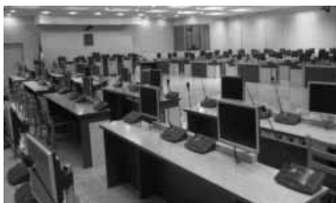
Sudnica u Višem sudu u Beogradu

Protiv Nedeljka Sovilja i Rajka Vekića vodi se ponovljeni postupak zbog ratnog zločina protiv civilnog stanovništva. Njima se optužnicom TRZ stavlja na teret da su kao pripadnici Vojske Republike Srpske, 21. decembra 1992. godine na lokalnom putu Jazbine – Bjelaj, opština Bosanski Petrovac, u šumi zvanj Osoje ubili jednog bošnjačkog civila.