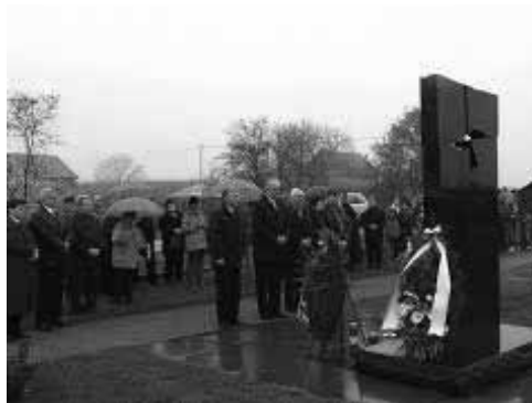
Spomenik stradalim civilima u Lovasu

Protiv Zorana Vukšića, Slobodana Strigića i Branka Hrnjaka vodi se ponovljeni postupak zbog ratnog zločina protiv civilnog stanovništva. Njima se optužnicom TRZ stavlja na teret da su kao pripadnici SUP-a Beli Manastir, 17. oktobra 1991. godine, u okolini Belog Manastira (Hrvatska) učestvovali u ubistvu četiri civila hrvatske nacionalnosti.