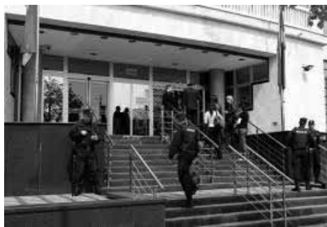
Odeljenje za ratne zločine Višeg suda u Beogradu

Zbog odsutnosti člana sudskog veća, suđenje koje je bilo zakazano za 13. maj nije se moglo održati, te je odloženo za 30. jun 2014. godine.