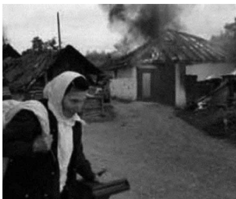
Uništavanje kuća i proterivanje stanovništva

Zakazano pripremno ročište nije se moglo održati zbog navodne bolesti jednog od optuženih, pa je sud odlučio da se obavi medicinsko veštačenje kako bi se utvrdilo da li je optuženi u stanju da prati tok krivičnog postupka.