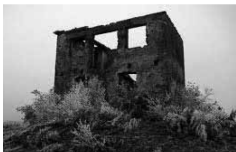
Kuća u Lovasu uništena tokom rata

Protiv Ljubana Devetaka i još 13 optuženih, vodi se ponovljeni postupak zbog ratnog zločina protiv civilnog stanovništva. Njima se optužnicom TRZ stavlja na teret da su kao pripadnici JNA, paravojne formacije "Dušan Silni" i lokalne vlasti, tokom oktobra i novembra meseca 1991. godine, u Lovasu (Republika Hrvatska) lišili života 41 civila hrvatske nacionalnosti.