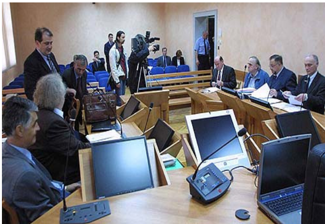
NOVI POSTUPAK: Suđenje u predmetu Ovčara