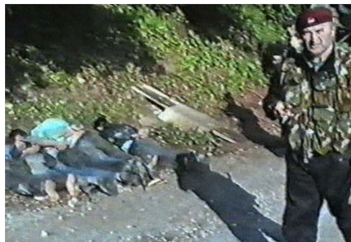
DŽELAT I ŽRTVE: Snimak neposredno pred likvidaciju šestorice Muslimana iz Srebrenice