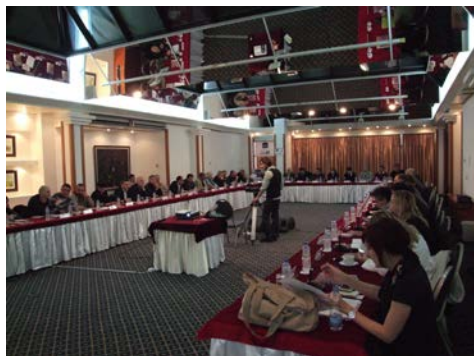
Nacionalne konsultacije sa veteranima, izbeglim i raseljenim licima, Beograd, 24. aprila 2010. godine.

strukturi i drugim važnim aspektima rada buduće komisije. njihova mišljenja i preporuke o ovim pitanjima upućeni su Radnoj grupi za izradu modela REKOM-a.