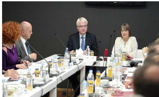
Sastanak NVO u Srbiji sa predsednikom Ivom Josipovićem, FHP, 19. juli 2010.

Predsednika Ive Josipovića sa predstavnicima civilnog društva u Srbiji. Sastanak je održan 19. jula 2010. godine u prostorijama FHP-a. Na njemu je učestvovalo preko 40 predstavnika organizacija civilnog društva iz cele Srbije, medija i OSCE. Teme sastanka bile su suočavanje sa prošlošću, sloboda kretanja, povratak izbeglica, vraćanje stanarskih prava i imovine, sloboda medija i prava marginalizovanih grupa kao što je LGBT populacija.