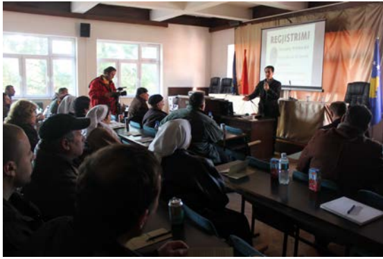
Prezentacija u Istoku/Istog, 21. januar 2010. godine.