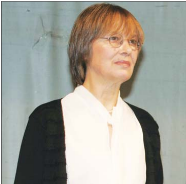
Nataša Kandić: Ispitati uloge civilne i tajne policije, te Vojske Srbije

- Između ostalog. Čelnici BIA su oduvijek imali podatke gdje se skrivao Radovan Karadžić, ali je njegovo hapšenje uslijedilo tek poslije političke promjene vlasti, te upravo odlaska Vojislava Koštunice sa mjesta premijera. Obavještajna služba Srbije je stvorila novi identitet ratnog zločinca Radovana Karadžića. No, vremenom je mreža pomagača postala suviše velika i skupa. I nisu to samo znali ljudi iz Srbije. Naravno da su i pojedine osobe iz Republike Srpske znale ko i kako pomaže haškom bjeguncu.