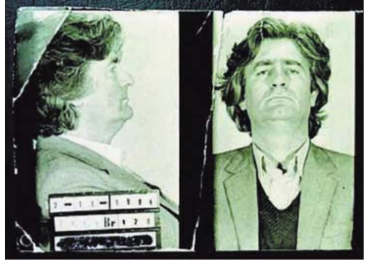
Karadžić uhapšen ranih 80-ih zbog afere sa gradnjom vikendice

Radovanovi lopovluci u aferi Invest inžinjerina