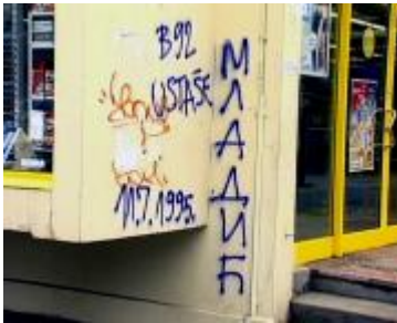
Grafit u blizini zgrade B92

Medijske spekulacije da će Mladić biti uhapšen izazvale su nezadovoljstvo njegovih pristalica koji su ispisali grafite sa nacionalističkim porukama. Osim u blizini zgrade B92, gde se pojavio grafit "B92 Ustaše" i "Ratko Mladić srpski heroj", ultra-desničari su noćas bili aktivni i u Nišu.