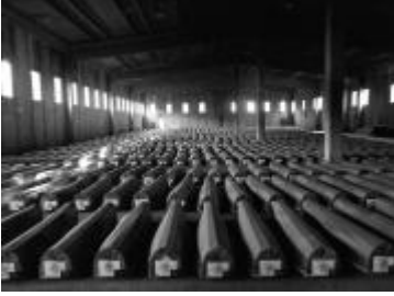
Sanduci s telima žrtava u Srebrenici

U drugom delu konferencije , održanom u subotu u beogradskom centru Sava, na temu "Srebrenica, van osnovane sumnje", koji je bio posvećen glasu i dostojanstvu žrtava, okupljenima su se obratile žene koje su izgubile najbliže u Srebrenici i begu iz Srebrenice u Potočare jula 1995, među kojima su bile Kada Hotić i Hiba Mehmedović.